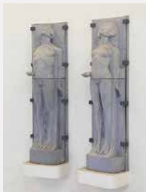
「ペートーヴェン・フリース」リヒャルト・ルクシュ Paire de figurines issues de la fontaine de Nietzsche, présentées dans la salle d'exposition principale de la frise de Beethoven Richard Luksch