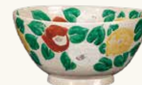
「つばき鉢」北大路魯山人 Bol décoré de camélias - KITAOKI Rosanjin