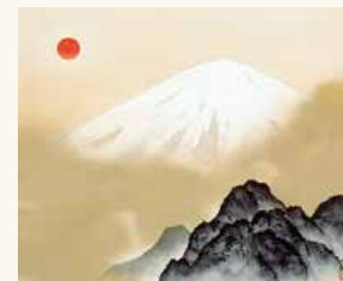
「不二靈峰」横山大観 Mont sacré Fuji - YOKOYAMA Taikan