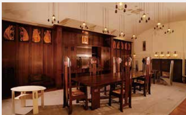
チャールズ・レニー・マッキントッシュの部屋 Chambre de Charles Rennie Mackintosh

飛騨高山の市街地にあるミュージアムです。建物はマヤ文明の遺跡を彷彿とさせ、展示室は美術、歴史、自然史に分かれています。国宝「太刀 銘 康次」を含む約2,000点の美術品を所蔵し、現代書、浮世絵、近代日本画、西洋絵画のコレクションがあります。歴史ではマヤ、インカを中心に世界各地の資料、自然史では飛騨地域の化石や恐竜模型の展示をしています。