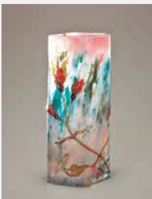
「フランスの薔薇」エミール・ガレ Vase "Rose de France" Emile Gallé