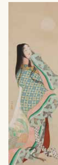
「紫式部図」上村松園 Mademoiselle Murasaki Shikibu - UEMURA Shoan