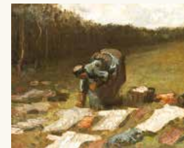
「洗濯をする農婦」フィンセント・ファン・ゴッホ Corvée de lavandières - Vincent Van Gogh