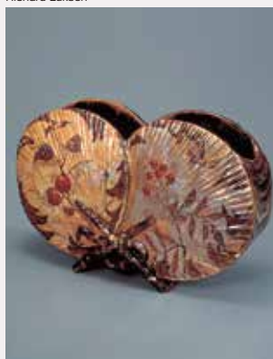
「扇型花器」エミール・ガレ Vase en forme d'éventail japonais Emile Gallé