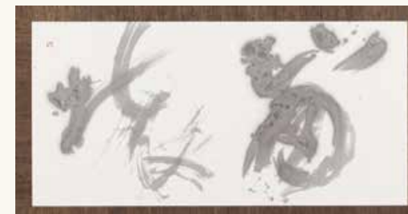
「崩壊」手島右卿 Effondrement - TESHIMA Yukei