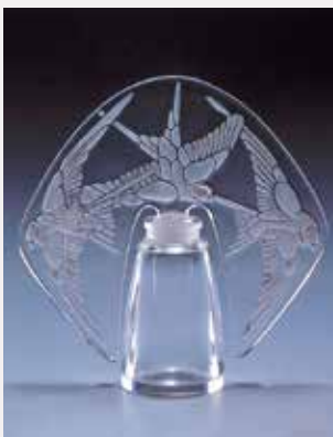
「3羽の燕の香水瓶」ルネ・ラリック Bouteille de parfum "Trois hirondelles" René Lalique