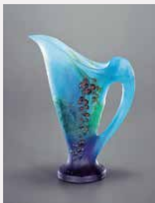
「木の実文水差し」アマリック・ワルター Pichet de baies Amalric Walter