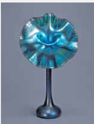
「ジャック・イン・ザ・バルビット」 ルイス・カムフォート・ティファニー Vase "Jack dans la chaire" Louis Comfort Tiffany

19世紀末、ヨーロッパで華麗に花開いたアール・ヌーヴォー様式。それは、ガラス工芸のみならず、家具や照明器具など日常生活のデザインにも取り入れられ多様な美の展開を見せました。飛騨高山美術館では、それらの装飾芸術にスポットを当て、またその後続くアール・デコや現代ガラスまで、約1,000点の作品を収蔵しています。