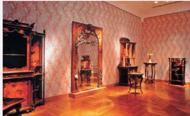
エミール・ガレの部屋 Emile Gallé and Art Nouveau Room