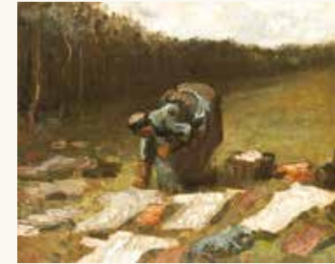
「洗濯をする農婦」フィンセント・ファン・ゴッホ [Peasant Woman Laundering] Vincent Van Gogh