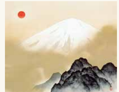
「不二靈峰」横山大観 [Sacred Mount Fuji] YOKOYAMA Taikan