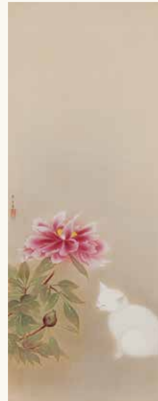
「牡丹睡猫」速水御舟 [Napping Cat and Peony] HAYAMI Gyoshu

HIKARU MUSEUM is located in the city of Takayama. The building is reminiscent of the remains of Maya civilization, and there are exhibition rooms of art, history and natural history. It has about 2,000 works of art, including the national treasure "Tachi: Long Sword forged by Yasutsugu", and it has the collections of contemporary calligraphies, Modern Japanese paintings, Ukiyo-e works and Western paintings. It exhibits the historical materials around the world mainly Maya and Inca, the fossils in the Hida area and the dinosaur models.