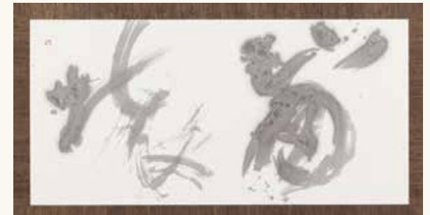
「崩壊」手島右卿 [Collapse] TESHIMA Yuhei