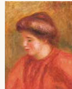
「ガブリエルの肖像」 ビエール＝オーギュスト・ルノワール [Portrait of Gabrielle] Pierre-Auguste Renoir