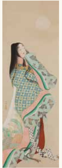
「紫式部図」上村松園 [Lady Murasaki Shikibu] UEMURA Shoen