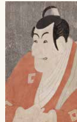
「市川蝦蔵の竹村定之進」東洲斎写楽 [Ichikawa Ebizo as Takemura Sadanoshin in the play "Koinyobo Somewake Tazuna"] TOSHUSAI Sharaku