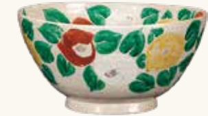
「つばき鉢」北大路魯山人 [Bowl Decorated with Camellias] KITAOJI Rosanjin