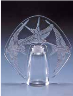
「3羽の燕の香水瓶」ルネ・ラリック [Perfume bottle "Three Swallows"] René Lalique

19世紀末、ヨーロッパで華麗に花開いたアール・ヌーヴォー様式。それは、ガラス工芸のみならず、家具や照明器具など日常生活のデザインにも取り入れられ多様な美の展開を見せました。飛騨高山美術館では、それらの装飾芸術にスポットを当て、またその後続くアール・デコや現代ガラスまで、約1,000点の作品を収蔵しています。