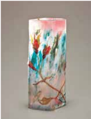
「フランスの薔薇」エミール・ガレ [Vase "Rose de France"] Emile Gallé