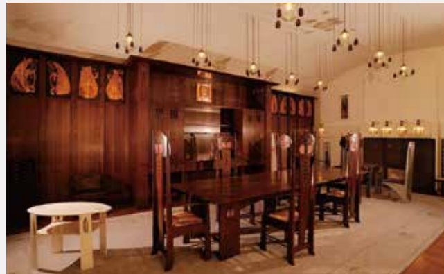
チャールズ・レニー・マッキントッシュの部屋 Exhibition Room of Charles Rennie Mackintosh

飛騨高山の市街地にあるミュージアムです。建物はマヤ文明の遺跡を彷彿とさせ、展示室は美術、歴史、自然史に分かれています。国宝「太刀 銘 康次」を含む約2,000点の美術品を所蔵し、現代書、浮世絵、近代日本画、西洋絵画のコレクションがあります。歴史ではマヤ、インカを中心に世界各地の資料、自然史では飛騨地域の化石や恐竜模型の展示をしています。