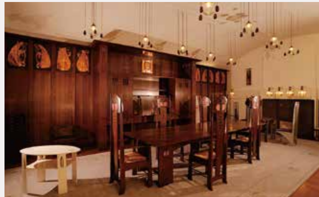
チャールズ・レニー・マッキントッシュの部屋 Charles Rennie Mackintosh之展示屋

飛騨高山の市街地にあるミュージアムです。建物はマヤ文明の遺跡を彷彿とさせ、展示室は美術、歴史、自然史に分かれています。国宝「太刀 銘 康次」を含む約2,000点の美術品を所蔵し、現代書、浮世絵、近代日本画、西洋絵画のコレクションがあります。歴史ではマヤ、インカを中心に世界各地の資料、自然史では飛騨地域の化石や恐竜模型の展示をしています。