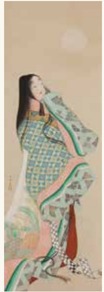
「紫式部図」上村松園 「紫式部女士」上村松園