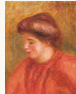
「ガブリエルの肖像」 ビエール＝オーギュスト・ルノワール 「Gabrielle肖像」Pierre-Auguste Renoir (雷諾瓦)