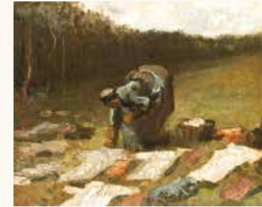
「洗濯をする農婦」フィンセント・ファン・ゴッホ 「洗衣農婦」Vincent Van Gogh (梵谷)