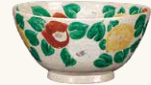
「つばき鉢」北大路魯山人 「山茶花碗」北大路魯山人