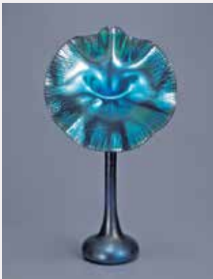
「ジャック・イン・ザ・パルピット」 ルイス・カムフォート・ティファニー 「Jack-in-the-Pulpit」花瓶」Louis Comfort Tiffany